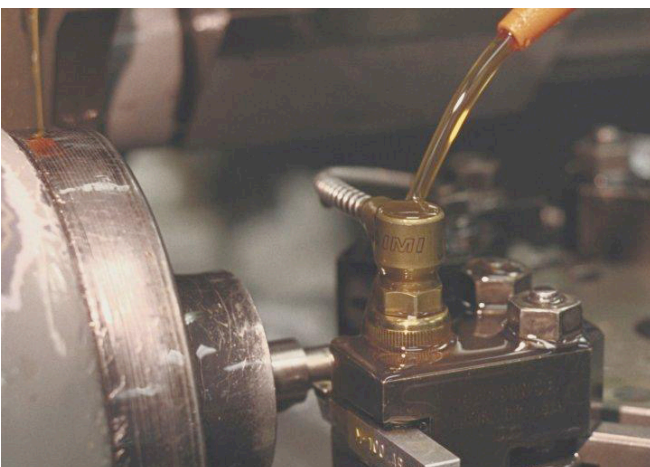
IMI 607A61 mit Swiveler®-Design und Kabel mit Schutzmantel eingetaucht in Schneidöl.

Die Gehäuse der industriellen Beschleunigungsaufnehmer von IMI bestehen aus Edelstahl und sind beständig gegen Korrosion und Chemikalien. Treten bei Ihrer Anwendung schädliche Chemikalien auf, so ziehen Sie den Einsatz von PTFE-Kabeln mit korrosionsfesten Schutzmanschetten am Steckverbinder in Betracht. Wir empfehlen dringend, für alle verdächtigen Chemikalien eine Verträglichkeitsliste zu Rate zu ziehen. Für Kabel, die mit Bohrspänen oder Schneidwerkzeugen in Berührung kommen können, bietet eine metallene Armierung hervorragende Sicherheit.