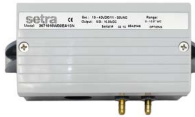
Modell 267 (mit und ohne Display)