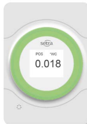
Modell SETRA Lite